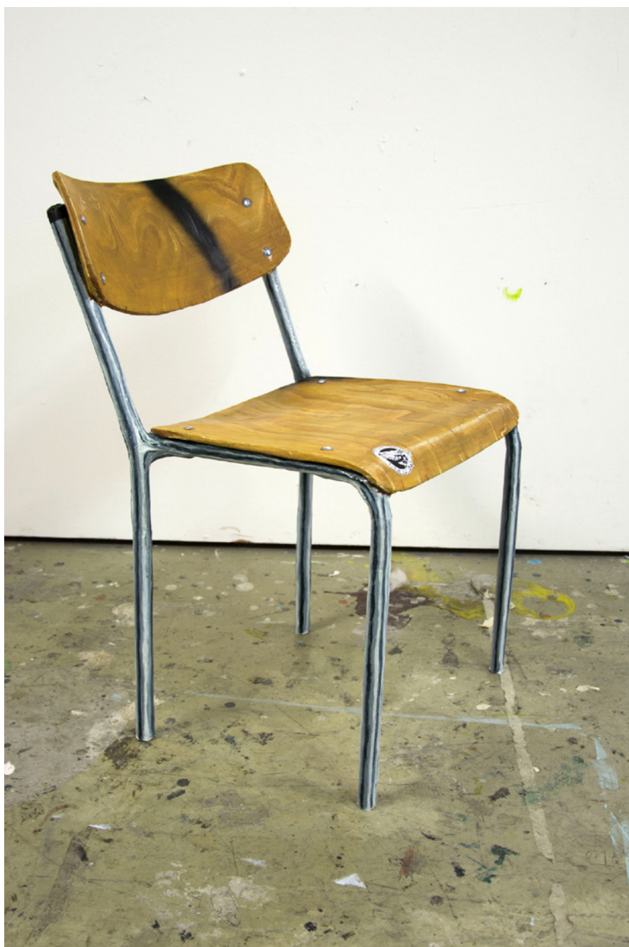
A.A.A.B., 2019 papier mâché, peinture, chewing-gum 40 x 47x 76cm

Diplômé de l'ésam Caen / Cherbourg et de la HEAD — Genève, il présente sa première exposition personnelle dans l'espace d'art genevois Duplex en 2018, suivi d'expositions collectives et en duo en Suisse, en France et en Allemagne. Vivant et travaillant à Genève, il bénéficie d'un atelier d'artiste à l'Usine mis à disposition par le fond municipal d'art contemporain.